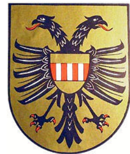
Wappen der Herrschaft Gemen

Im 17. Jahrhundert war Gemen eine Herrschaft, der ein Adliger vorstand, der auf der Burg Gemen lebte — eine Wasserburg, die 1274 erstmals erwähnt wurde und heute noch existiert. Unsere Vorfahren lebten wahrscheinlich unter der Herrschaft des ansässigen Grafen, Graf Limburg-Styrumb. Zu der Zeit war die Kapelle der Burg die einzige Kirche in Gemen, so dass alle Geburten, Hochzeiten und Todesfälle der Gemeinde dort verzeichnet wurden. Die Kirchendokumente lassen den Schluss zu, dass Adelige der Limburg-Styrumb Familie gelegentlich bei der Taufe einiger Nielands in Gemen anwesend waren. Weil die Namen unserer Vorfahren nicht in den Steuerlisten auftauchen, können wir davon ausgehen, dass sie keine Landbesitzer waren. Sie waren vielleicht Kleinbauern, Handwerker oder Händler.